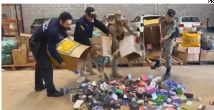
Em janeiro e fevereiro apreensão já é 1/3 do total recolhido em 2023

De acordo com a PRF, o produto é produzido na China e exportado para o Paraguai. Ele entra no Brasil ilegalmente pelo Paraná e Mato Grosso do Sul, estados que fazem fronteira com o país vizinho. A corporação detalha que Goiás, por ser um estado de localização geográfica centralizada, com rodovias ligando as regiões norte, nordeste e sudeste do