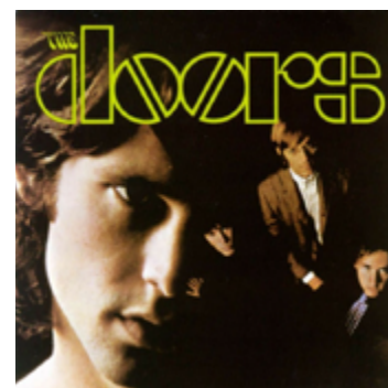
“The Doors”, de 1967

“The Soft Parade” foi considerado repetitivo. Entre shows arriscados (Morrison foi preso num deles, em Miami) e visto como perigoso (por causa da medida), o grupo voltou às raízes em “Morrison Hotel”, de 1970. O impacto começa na primeira música, “Roadhouse