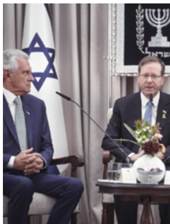
Ronaldo Caiado em encontro com o presidente de Israel, Isaac Herzog: líder israelense agradece apoio dos brasileiros