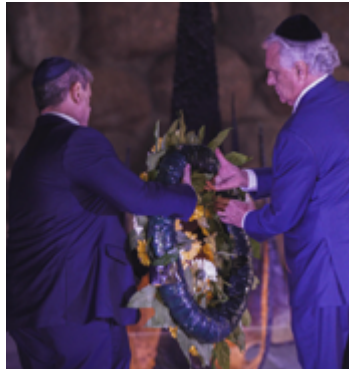
Ronaldo Caiado e Tarcísio de Freitas prestam homenagens às vítimas do nazismo no Museu do Holocausto

A missão internacional do governador termina amanhã com visita técnica em indústrias aeroespaciais e startups das áreas de mobilidade e acessibilidade, além dos ministérios da Defesa e Relações Exteriores. Ainda está na agenda do governador encontros com parentes dos reféns do Hamas.