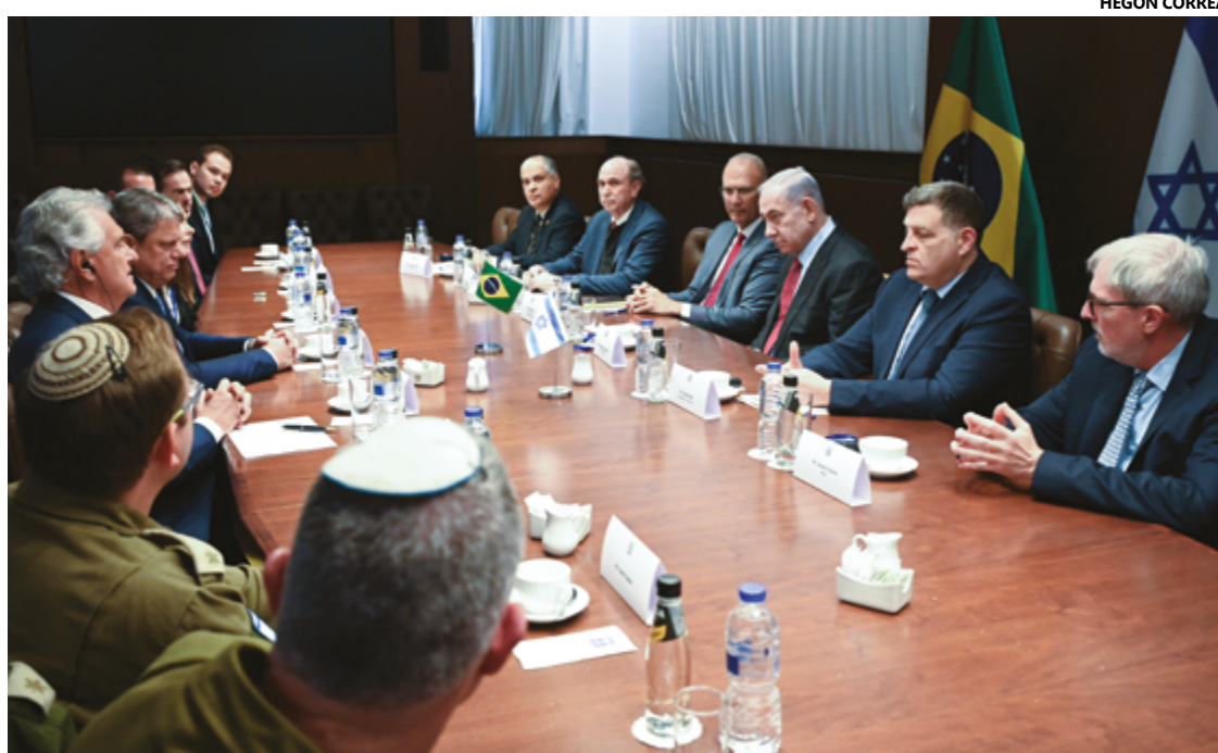
Encontro de Ronaldo Caiado e Benjamin Netanyahu nesta terça-feira, 19, a portas fechadas e durou 1 hora

Sobre o atentado sofrido em 7 de outubro, Caiado contou ao presidente que o Governo de Goiás homenageou as vítimas com a recente inauguração do