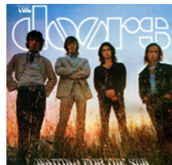
“Waiting For The Sun”, de 68