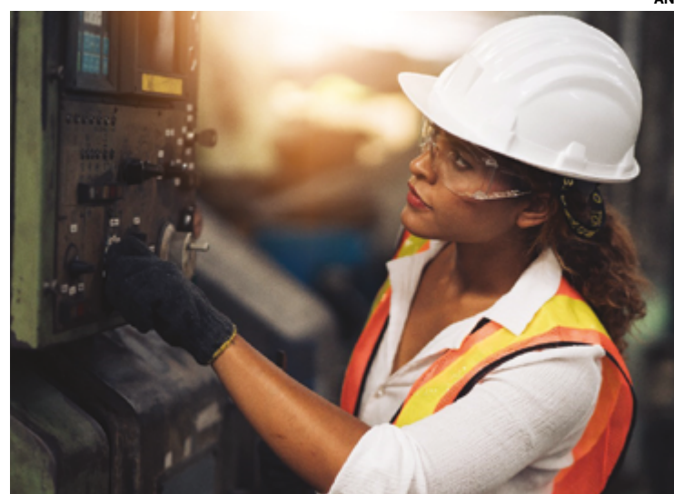
Além de comprometimento com a equidade de gênero, empreendimentos ganham reconhecimento por acolhimento a vítimas de violência

"Do ponto de vista legal e até laboral, o que fica nítido na proposta é que não é nada mais do que o cumprimento da obrigação. Entretanto, sou uma defensora de que incentivemos as boas práticas por meio do reconhecimento pú-