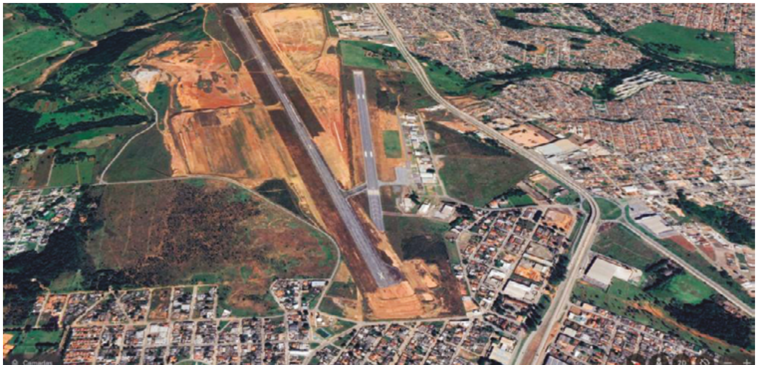
Iniciada em 2010, obra já teria consumido cerca de R$ 350 milhões; previsão é de mais R$ 180 milhões para dar condições de operacionalidade

Nos encontros com Caiado e Naves, o ministro Sílvio Costa Filho afirmou que determinaria a criação de uma força-tarefa para agilizar as articulações entre a Infraero, empresa pública nacional subordinada ao ministério, e o governo goiano. “Vamos validar os documentos e, na sequência, quero minha equipe empenhada neste projeto para que aquele aeroporto seja um grande centro de distribuição logística”, garantiu o ministro.