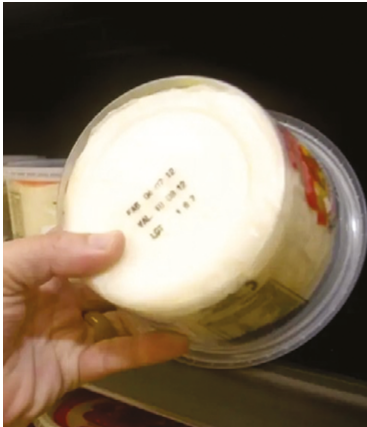
Em um supermercado da cidade, no semestre passado, foram encontrados 150 kg de produtos vencidos sendo ofertados aos clientes

mou ainda que os disque-cerveja também são locais onde os fiscais costumam encontrar produtos vencidos. “O sujeito vai a uma festa, passa mal e acaba culpando a maionese, mas em alguns casos é cerveja vencida mesmo”, disse Velasco. Nas últimas operações, foram apreendidos 7 mil litros de cervejas vencidas em estabelecimentos de Anápolis.