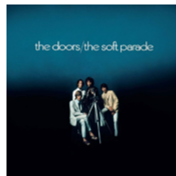
“The Soft Parade”, de 69

Blues”, que tem Lonnie Mack no baixo e John Sebastian, da banda Lovi’n Spoonful, na harmônica. Funk buliçoso, “Pearce Fog” retrata o clima de convulsão social do período. Três pérolas ainda estão no repertório: “Blue Sunday”, “The Spy” e “Indiana Summer”.