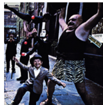
“Strange Days”, 67