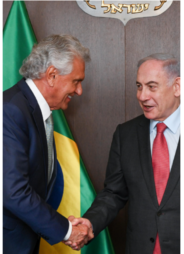
Governador Ronaldo Caiado se reúne com primeiro-ministro de Israel, Benjamin Netanyahu